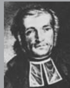
18. 8. 1772 Bystrička pri Martine 21. 3. 1837 Liptovský Mikuláš

Pochovali ho na mestskom cintoríne a po jeho zrušení v máji roku 1975 preniesli jeho pozostatky na vrbický cintorín.