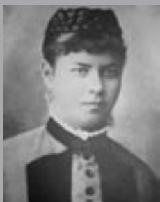
1871 Lučenec 1912 Liptovský Mikuláš