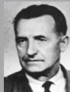
4. 11. 1905 Bílavsko na Morave 14. 7. 1997 Liptovský Mikuláš