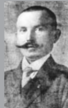
27. 1. 1878 Liptovská Sielnica 16. 10. 1951 Liptovský Mikuláš

Ľudovú školu navštevoval v Sielnici, bol pomocným robotníkom a nádenníkom v Sielnici, garbiarskym robotníkom v Liptovskom Mikuláši, v roku 1906 sa stal spoluzakladateľom a funkcionárom sociálnodemokratickej odborovej organizácie liptovsko-mikulášskych kožiarskych robotníkov. Spoluorganizoval zhromaždenia na 1. mája 1918, na ktorom sa slovenskí robotníci prihlásili k sebaurčovaciemu právu národa a k spoločnému štátu Čechov a Slovákov. V roku 1918 bol členom Slovenskej národnej rady a jej výboru, signatárom martinskej Deklarácie slovenského národa, spoluorganizátorom všeludového zhromaždenia v Liptovskom Mikuláši 8. 12. 1919. Ako člen predsedníctva sa zúčastnil zjazdu slovenských sociálnych demokratov 25. 12. 1918 v Liptovskom Mikuláši, na ktorom sa zlúčili s českými sociálnymi demokratmi do Československej sociálnodemokratickej strany. Bol funkcionárom až do jej rozpustenia. Písal do ľavicovej tlače. V rokoch 1918 – 1920 bol poslancom Národného zhromaždenia v Prahe, od roku 1921 členom výkonného výboru Československej sociálnodemokratickej strany na Slovensku.