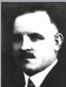
15. 12. 1875 Tovačov, okres Přerov 7. 5. 1961 Liptovský Mikuláš