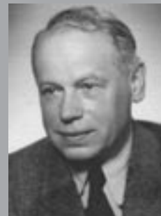
4. 10. 1891 Liptovský Mikuláš 8. 3. 1948 Liptovský Mikuláš