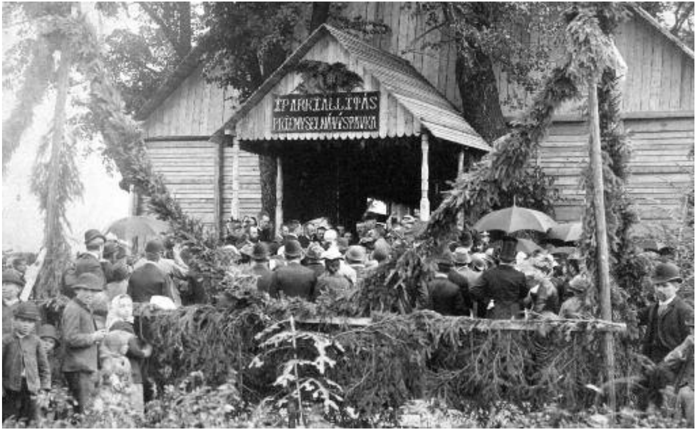
Pred výstavným pavilónom.