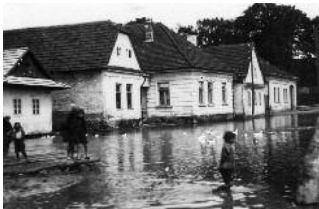
Povodeň na nižnom konci Vrbcice