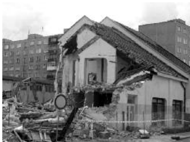
Z Mikuláša práve mizne ďalšia originálna budova. Asanácia bývalého Domu zeleniny.

Teplá zima umožnila aj tento rok stavebníkom pracovať v plnom tempe. Pred očami nám mizne, či sa mení starý biskupský úrad na Bellovej ulici – hydraulické zbjíjačky zničili za pár hodín krásnymi štukami vyzdobené okná aj s časťami múrov – to, čo zhruba pred storočím pomaličky a s citom vystavali v celom Uhorsku známi liptovskí staviteľia a murári... Aj zvláštna stavba, ktorú si mnohí pamätáme ako Dom zeleniny (v minulosti bola súčasťou vrbického Mikovie veľkostatku) padla. S obavami chodím okolo Stodolovského domu na bývalom Vyšnom Huštáku – ako dopadne miesto narodenia fyzika svetového mena Aurela Stodolu? Pamätná tabuľa s odlomenými roškami už leží v múzeu – bude ju kam vrátiť?