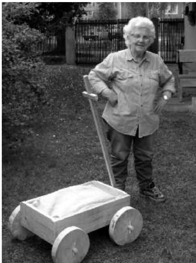
Pani Hrabinská a hurtovnica.