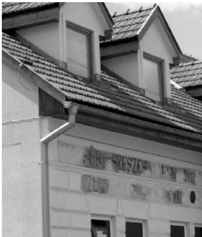
Citlivo zrekonštruovaná fasáda.