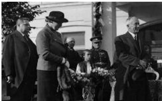
Prezident Beneš s manželkou pred budovou okresného úradu.

Druhý československý prezident Dr. Edvard Beneš poctil Liptovský Sv. Mikuláš svojou návštevou v septembri 1936, pri príležitosti 300. výročia vydania kancionála Juraja Tranovského Cithara Sanctorum. Hoci návšteva Mikuláša nebola pôvodne v prezidentovom pláne, význam, ktorý prikladal Tranovského kancionálu, ho primäl, aby sa zúčastnil na oslavách výročia tejto kultúrnej pamiatky.