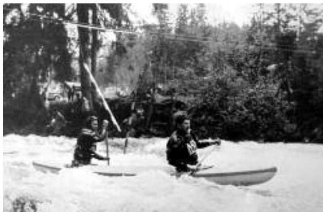
Tatranský vodný slalom, Podbanské, 1966. Na trati Rázus – Rajník.

Silvester Štric bol fotografom premien Liptova, fotografom športových udalostí... a snáď v najväčšom zastúpení vodného slalomu – športu, ktorý Liptovu a Liptovskému Mikulášu priniesol mnohé úspechy i olympijských víťazov.