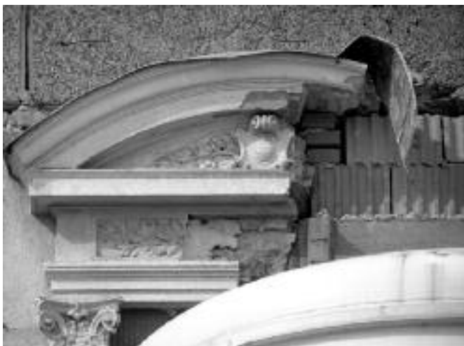
Čo je staré, musí preč...?!