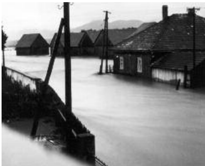
Balážovíe dom na Sihoti vo Vrbcici

Jedna z najväčších živelných pohrôm posledných desaťročí postihla Liptov v roku 1958. 29. júna sa Váh i mnohé jeho prítoky vyliali z brehov. Povodeň pustošila i v Liptovskom Mikuláši. Postihla najmä bývalú Vrbcicu či Palúdzku – lokality v tesnej blízkosti Váhu. V archíve Múzea Janka Kráľa opatrujeme fotografie, ktoré nielen zachytili vyčíňanie vodného živlu, ale sú i dokladom veľkých premien mesta – mnohé z objektov a domov na obrázkoch spred päťdesiatich rokov už nestoja.