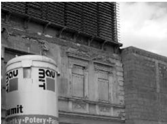
Premena budovy na Bellovej ulici.