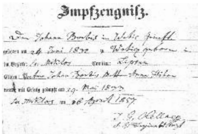
Potvrdenka o povinnom očkovaní z roku 1833.