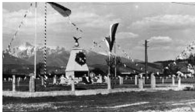
Dobová fotografia Pamätníka žiadostí slovenského národa na mieste ich vyhlásenia v bývalých Ondrašoveckých kúpeľoch, dnes Revolučnej ulici.