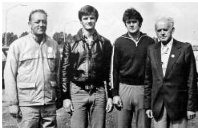
Cibákovci – reprezentanti Československa.

a náročný krásny šport sa dostával vďaka úsiliu mnohých nadšencov čoraz viac do povedomia ľudí. Postupne k popularite vodného slalomu prispievali i fotografie či novinové správy Silvestra Štrica. Neúnavne fotil, písal a posielal do športových redakcií výsledky zápolení z najrôznejších športových podujatí. Vo svojich aktivitách neustal, a tak sa jeho domáci archív stal zároveň akousi fotokronikou najmä mikulášskeho športu. Plánoval ju predstaviť na širšie zameranej výstave, no osud mu už nedoprial vybrať a usporiadať obrázky podľa svojich predstáv. Na podnet mikulášskeho Kanoe Tatra klubu bol však v Múzeu Janka Kráľa verejnosti v máji 2008 sprístupnený výber autor-ských fotografií pod názvom Z histórie šesťdesiatich ročníkov Medzinárodného Tatranského slalomu na fotografiách Silvestra Štrica. Na päťdesiatich čiernobielych a vyše tridsiatich fareb-