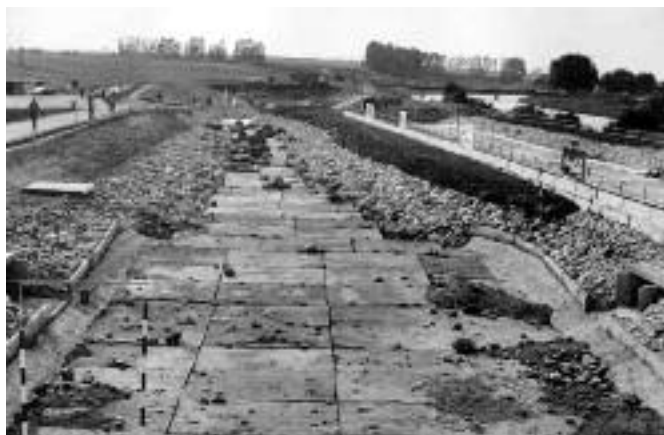
Výstavba areálu vodného slalomu, 1977.

Keď Silvester Štric v roku 1960 prišiel do Liptovského Mikuláša, mal už Tatranský slalom prvé desaťročie za sebou. Vodní slalomári súťažili striedavo na vodách Belej, či Váhu